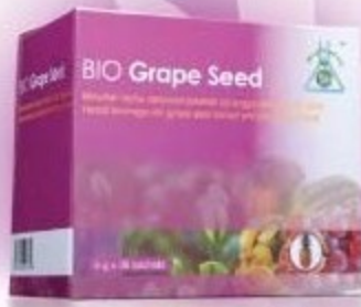
BIO GRAPE SEED