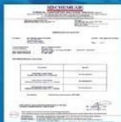
Malaysia Bacteriological Analysis