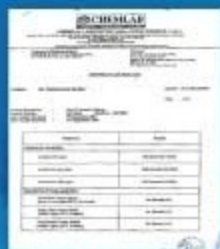
Malaysia Lab Test from Chemical Laboratory (M) Sdn Bhd