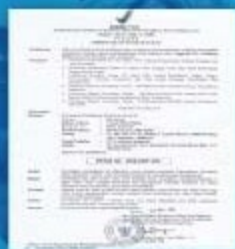
Indonesia DEPKES Approval