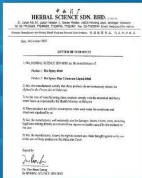
Letter of Indemnity from Herbal Science