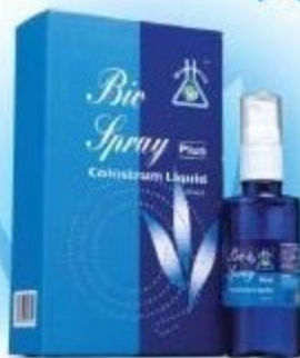
BIO SPRAY PLUS