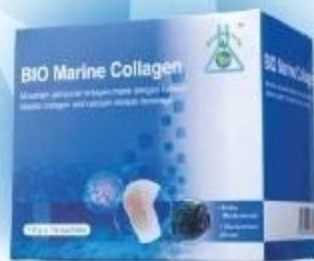
BIO MARINE COLLAGEN