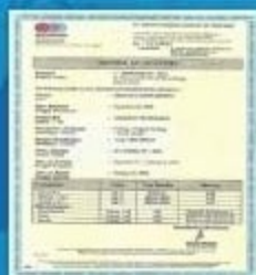
Sucofindo Laboratory Report from Indonesia