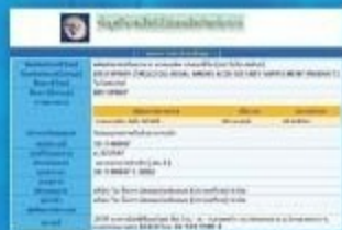
Thailand FDA Approval