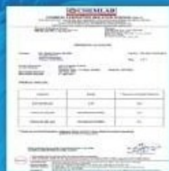
Malaysia Chemical Analysis