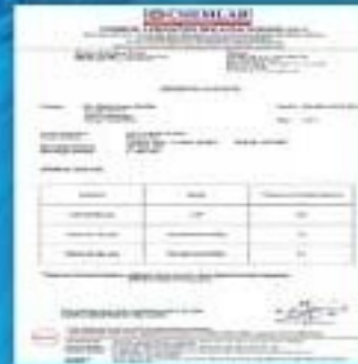
Malaysia Chemical Analysis