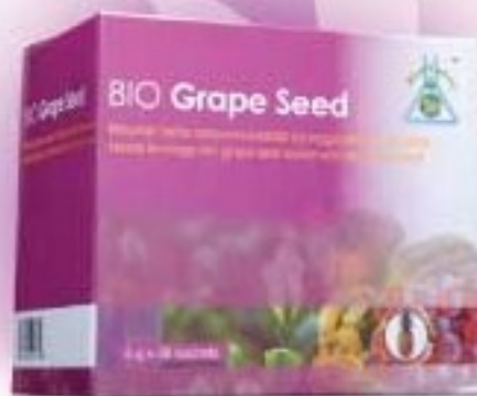
BIO GRAPE SEED