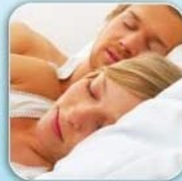
Penurunan Fungsi Seksual