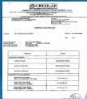
Malaysia Lab Test from Chemical Laboratory (M) Sdn Bhd