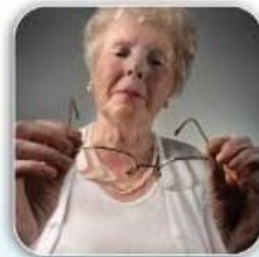
Penglihatan Yang Kabur