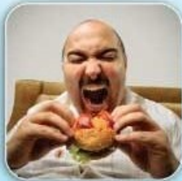
Lemak Badan Meningkat