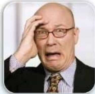
Keguguran Rambut & Uban