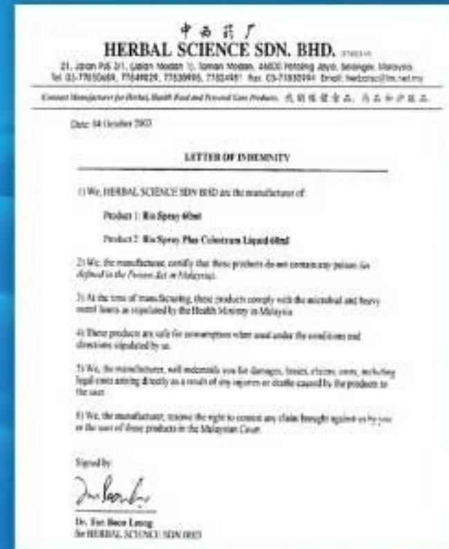
Letter of Indemnity from Herbal Science