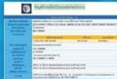
Thailand FDA Approval