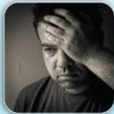
Masalah Kesukaran Tidur