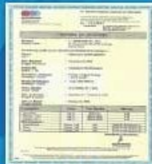
Sucofindo Laboratory Report from Indonesia