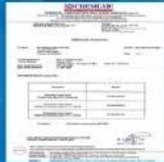
Malaysia Bacteriological Analysis