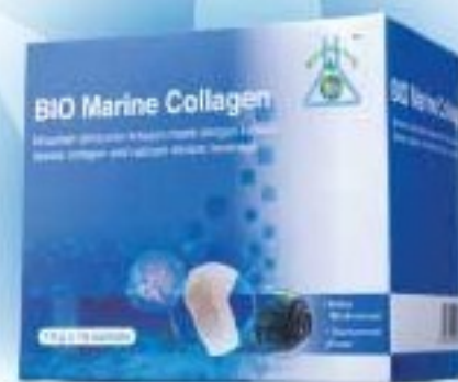
BIO MARINE COLLAGEN