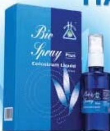
BIO SPRAY PLUS