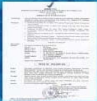
Indonesia DEPKES Approval