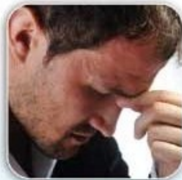
Kemerosotan Daya Ingatan